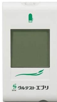
グルテストエプシロン