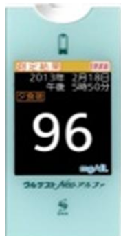
グルテストNeoアルファ