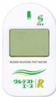
グルテストエースR